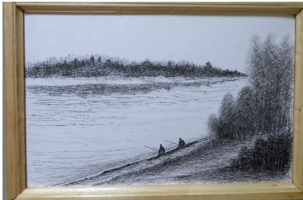
«Рыбаки», бумага/тушь, 2021 г.