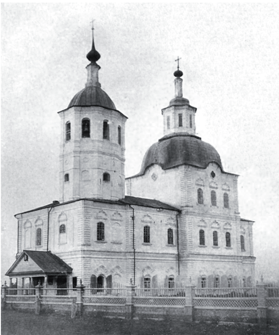
Церковь в селе Демьянском переносилась не единожды из-за обвалов берега.