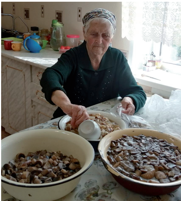
Работы хватает и в 90 лет.