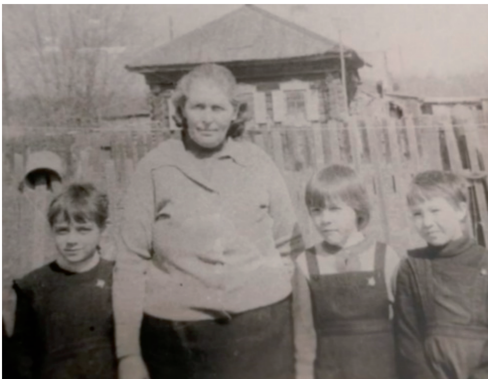
С учениками Родинской школы.