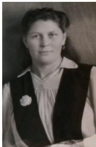
Выпускница учительского института.