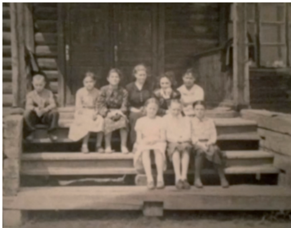
В первые годы педагогического труда.