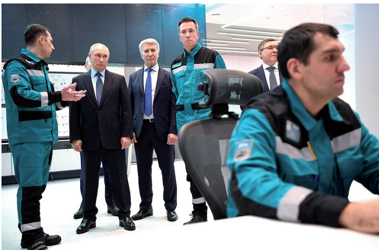
В ходе посещения нефтехимического комбината «ЗапСибНефтехим».