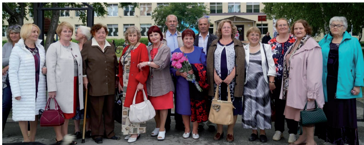
Встреча через 50 лет с выпускниками 1969 года.