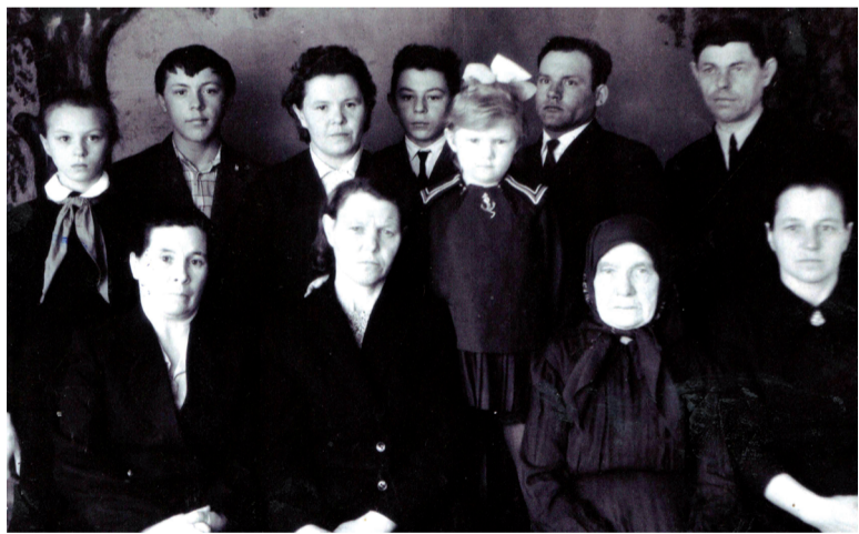
В кругу родных (1966 г.).