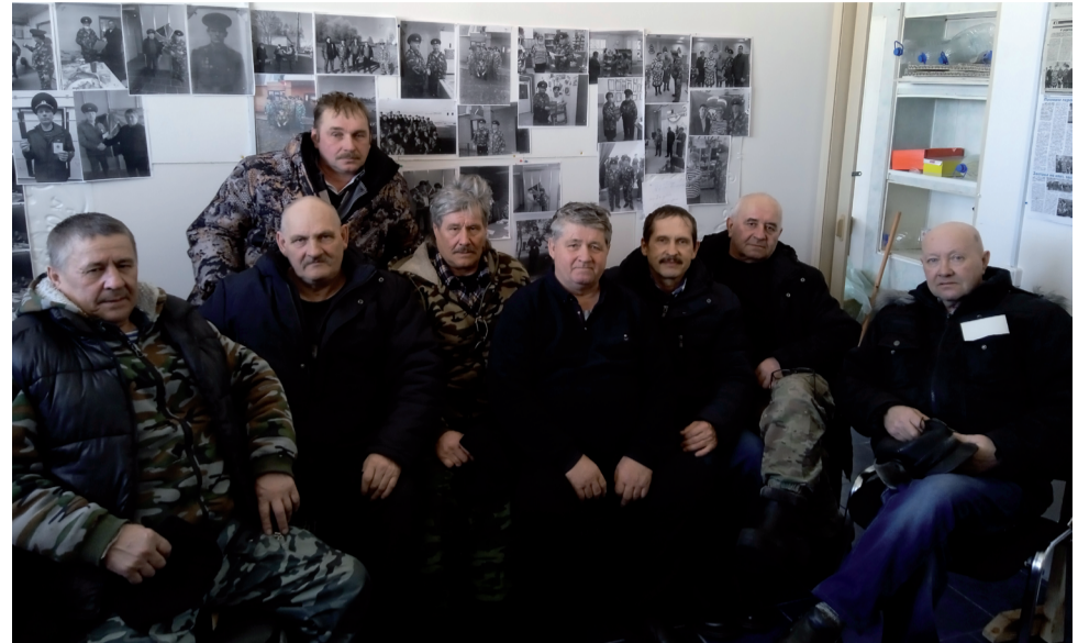
Инициативная группа по увековечению истории посёлка.

Мы предлагаем на высоком берегу реки Туртас, где мы в детстве купались, на месте, любезно предоставленном Туртасским лесничеством, поставить стелу с табличкой от благодарных земляков и оборудовать место для отдыха. Сделать дорожку до кладбища и благоустроить его. Привести в порядок могилы ветеранов