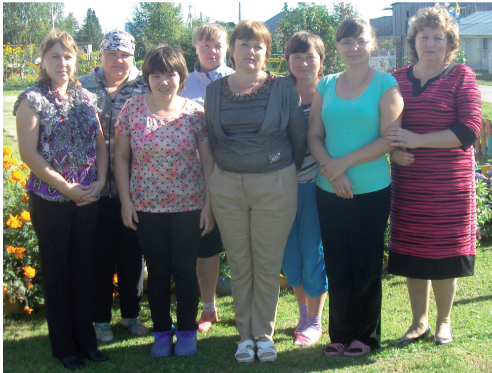
Коллектив детского сада «Рябинушка».

Что касается материальной базы для занятий и игр детей, то она совершенствуется постоянно. В прошлом году закуплено оборудование для организации центра воды и песка. На сегодняшний день это любимое место занятий у детей. Тогда же заменили почти все игрушки. Вот и премия за победу в конкурсе планируем потратить на обустройство спортивного зала (он же и