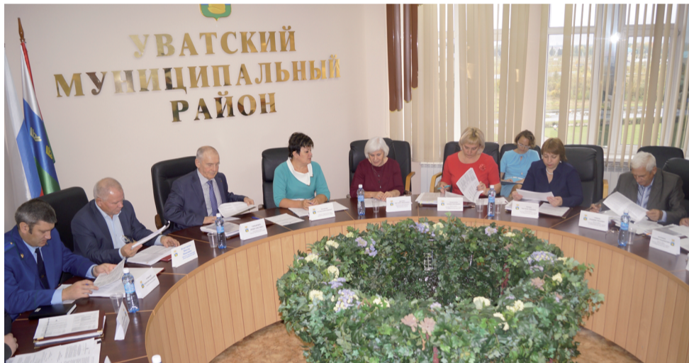
Депутаты за работой.