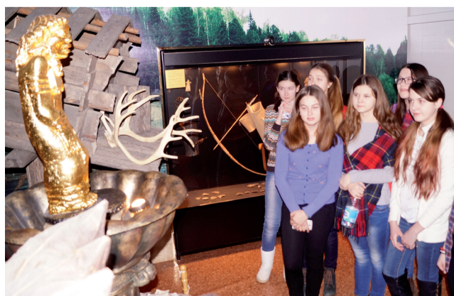
Школьники из Тобольска на экскурсии в музее.