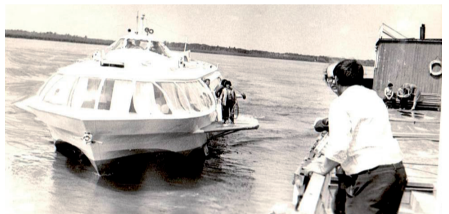
На Уватской пристани (1980-е годы).

Согласно «Ведомости о церкви» Тобольско-подгорного воеводства Уватского села Спасской церкви за 1838 год церковь располагалась на каменном фундаменте, снаружи и внутри была оштукатурена.