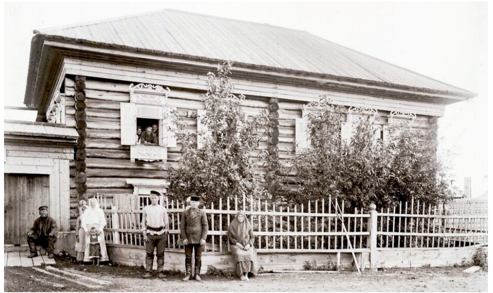
с. Уват. Дом крестьянина (1912 г.).