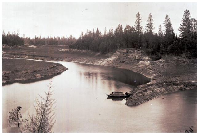
Речка Глухая вблизи Увата (1912 г.).