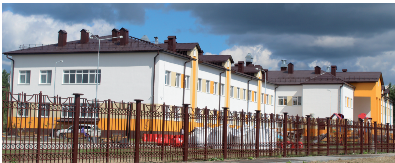
Новая школа в Увате построенная под руководством В. Крука.