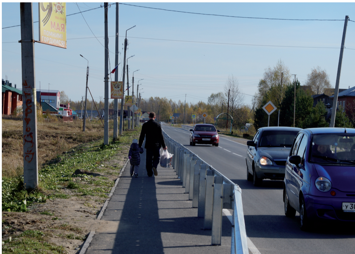
Обновлённая улица Ленина посёлка Туртас.