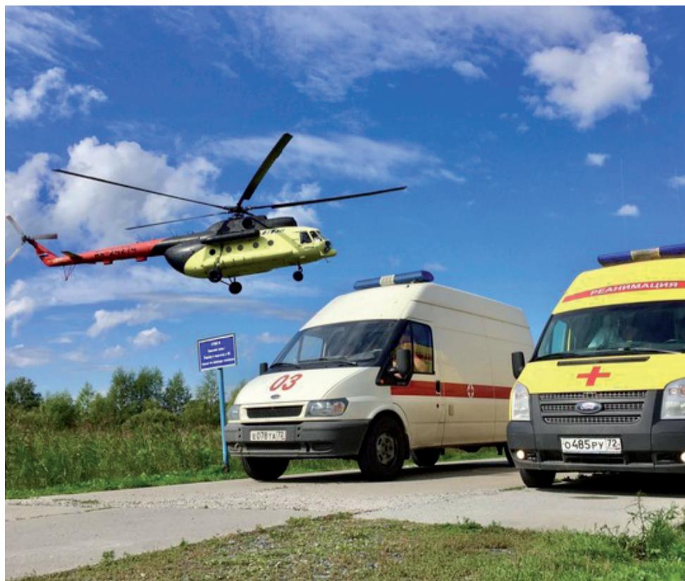
Для каждого конкретного случая на помощь человеку отправляется специализированная бригада.

Расстояние и распутица - не преграда, если необходима экстренная медицинская помощь. Медики медицины катастроф всегда на страже здоровья жителей труднодоступных районов.